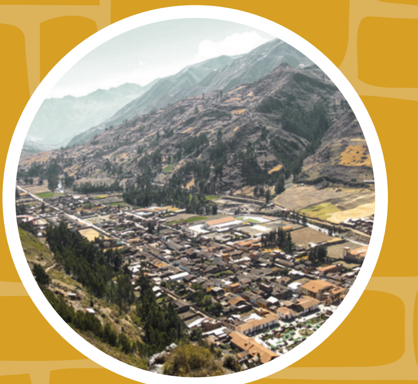
Pueblo de Chavín de Huántar