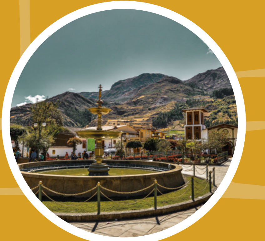
Plaza de Chavín de Huántar